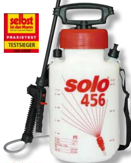
456 / 457

Die Profis unter den Druckspritzen mit 5 und 7,5 Litern. Eine 330 cm 3 -Pumpe erzeugt den Arbeitsdruck von 3 bar in erstaunlich wenigen Pumphebungen.