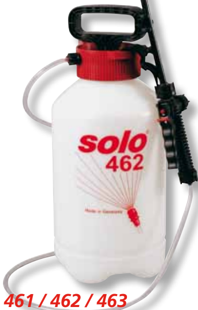
461 / 462 / 463

Das wirtschaftliche Optimum bei 5, 7,5 und 11 Liter-Nutzvolumen und 3 bar Arbeitsdruck.