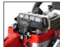
Großflächiger Luftfilter aus Nylon für lange Standzeiten; werkzeuglos wechselbar