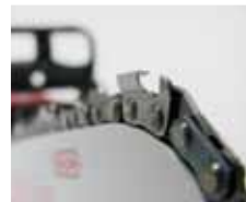
Vollmeißelkette für aggressiven Schnitt