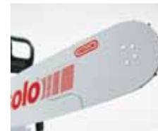
Vollstahlschiene für professionellen Einsatz