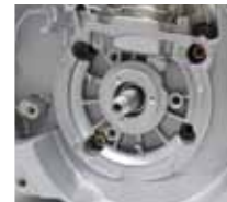
Extrem belastbare Magnesium-Kurbelgehäuse und Hauptgehäuse. Kompakte Bauweise.