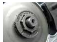
Powermate® Ritzel Zweiteilige professionelle Kupplungsglocke mit austauschbarem Kettenring