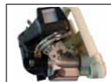
Vergaser mit Kompensator